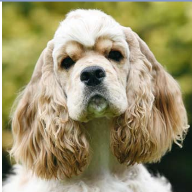
Blonde reu van 9 maanden.

Springing Spaniels. Ze stonden in verhouding tot deze Springing Spaniels ook korter op de benen en hadden vaak een iets meer gekrulde vacht. De vachtkleuren waren voornamelijk wit-rood, zwart-wit, leverkleurig-wit en éénkleurig in rood, zwart en leverkleur.