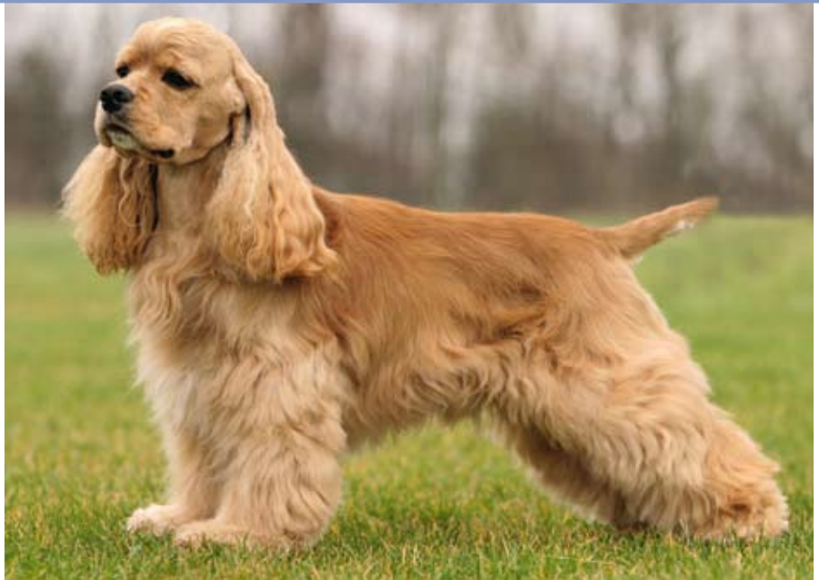
Huis- of puppylook.

stevig en compact lichaam, een licht aflopende topline, een vrij en vrolijk gangwerk. Kenmerkend voor het ras is zijn mooie hoofd met de donkere grote ogen, zijn prachtige expressie, en een vrolijke en vrije persoonlijkheid. In huis is het een gemakkelijke, gezellige huisvriend die zeer geschikt is om in gezinsverband te leven. De hond is altijd bereid om tot actie over te gaan en om een lolletje uit te halen. In gezinnen met kinderen is hij dan ook goed op zijn plaats. Wel is het belangrijk dat hij vanaf zijn puppytijd in een dergelijk gezin geplaatst wordt omdat hij ook wat terughoudend kan zijn ten opzichte van dingen die hij niet kent. Hij leeft in harmonie met andere huisdieren en is eigenlijk snel tevreden. Wel is hij binnen- en buitenshuis zeer actief: binnen met al zijn speeltjes waarvan hij er nooit genoeg heeft en buiten rent hij vrolijk rond en ziet hij iedere vogel voorbij gaan. Menig Ami is een betere muizen- maar ook vogel-vanger dan de kat. Veel Amerikaanse Cockers volgen de gehoorzaamheidstrainingen bij hondenscholen of kynologenclubs, wat altijd aan te bevelen is, doen aan Flyball of behendigheid maar ook zijn er af en toe Cockers te zien bij jachtrainingen. Een wandeling in de buurt, of naar bos of strand, dat is zijn lust en leven maar met zijn lange beharing kan dat soms toch wat problemen opleveren.