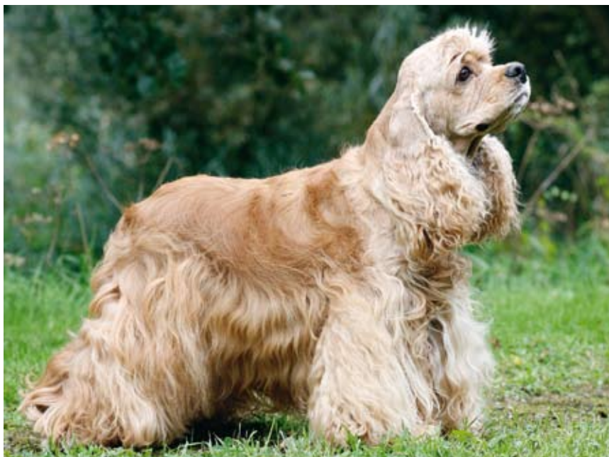
Blond teefje van 5 jaar.