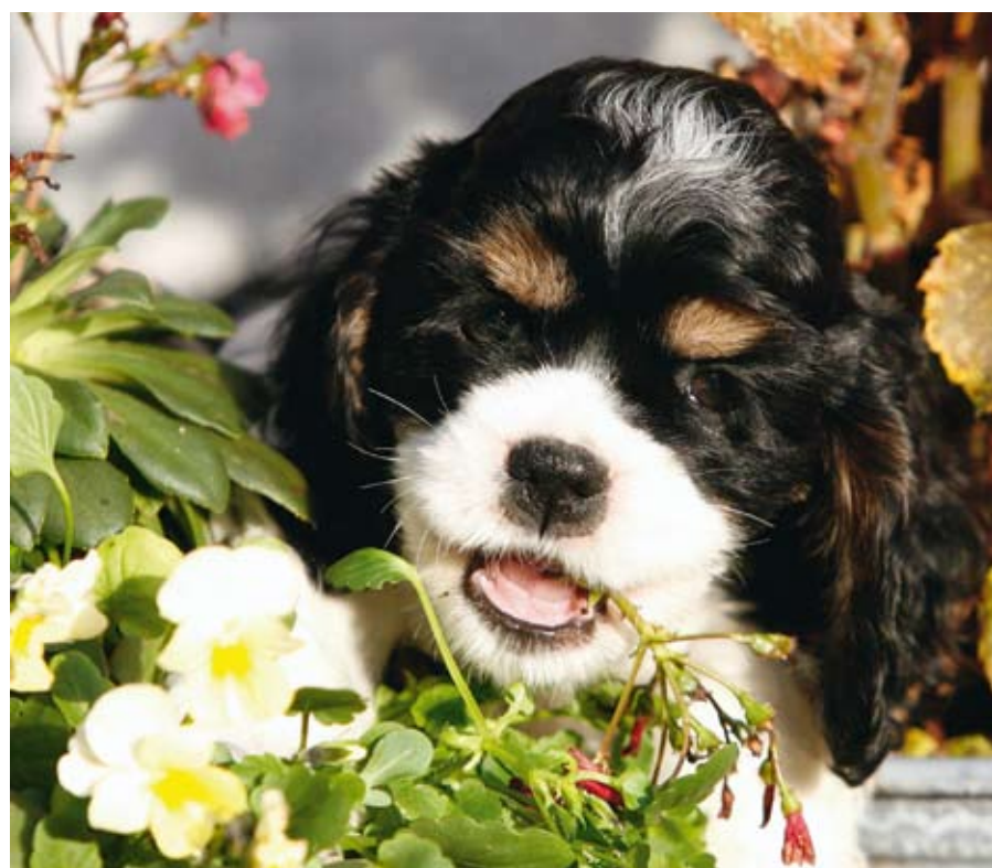
Driekleur teef puppy.